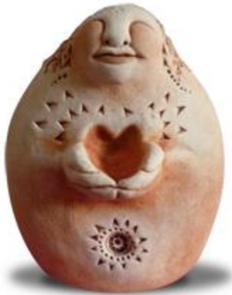
Estátua criada por Debbie Berrow www.bellpineartfarm.com