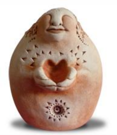
Statue by Debbie Berrow www.bellpineartfarm.com